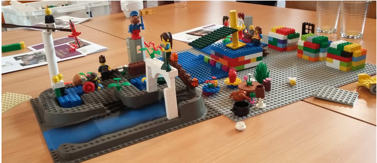
het zwembad, anno 2030

met een zwembadgedeelte voor rolstoelgebruikers, met een glijbaan, met een springplank, met een waterattractie, met een taverne vlak naast het zwembad, als vernieuwd zwembad, met een mascotte-figuurtje in het zwembad