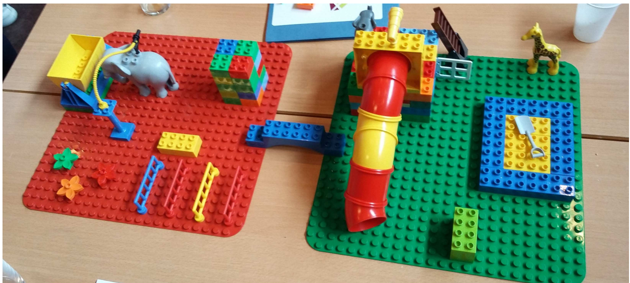
het Beekpark, anno 2030

met een kinderboerderij, met een fit-o-meter met sport-oefen-toestellen in het park, met een speels element in het water of iets leuks met water, met enkele speeltuigen (al weten we inderdaad wat deze in 't Hofke staan)