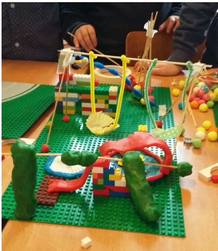
Beekpark of Hofke (Tibourschrans) in 2030

met weer enkele nieuwe leuke speeltuigen/speeltoestellen (deathride, leuke inkompoort, speciale schommels, een waterattractie of iets met bootjes op het water