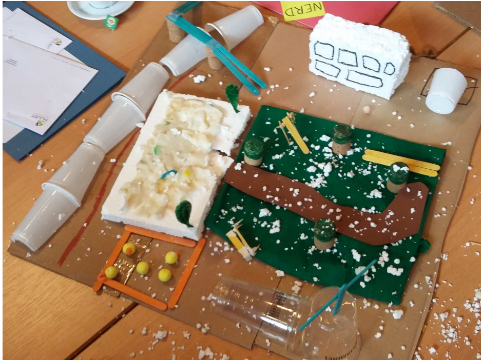
het kerkplein, anno 2030

met een ondergrondse parking, als groen speelpark, met een overkapping over de spoorweg, met kippen die etensrestjes van omwonenden (in appartementen) kunnen op eten, met in de winter een ijspiste, met enkele kleine speeltuigen